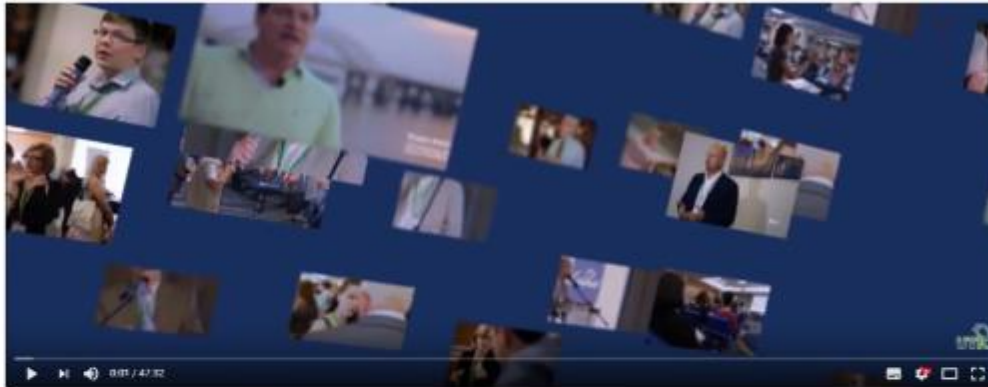
UTIC Webinar-2017. Grammarly Under the Hood